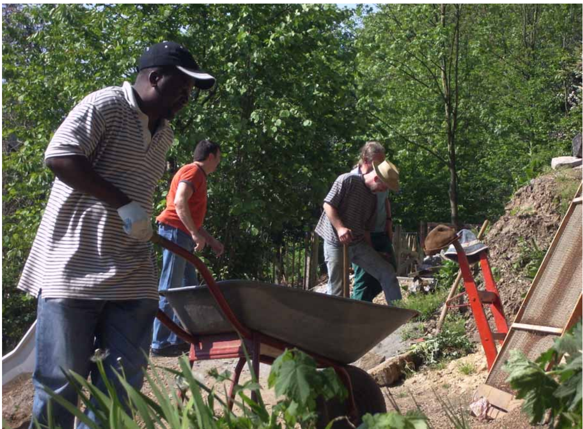
Eltern und Freunde der Schule beim Arbeitseinsatz. Lehrer und Schüler haben ebenfalls teilgenommen.