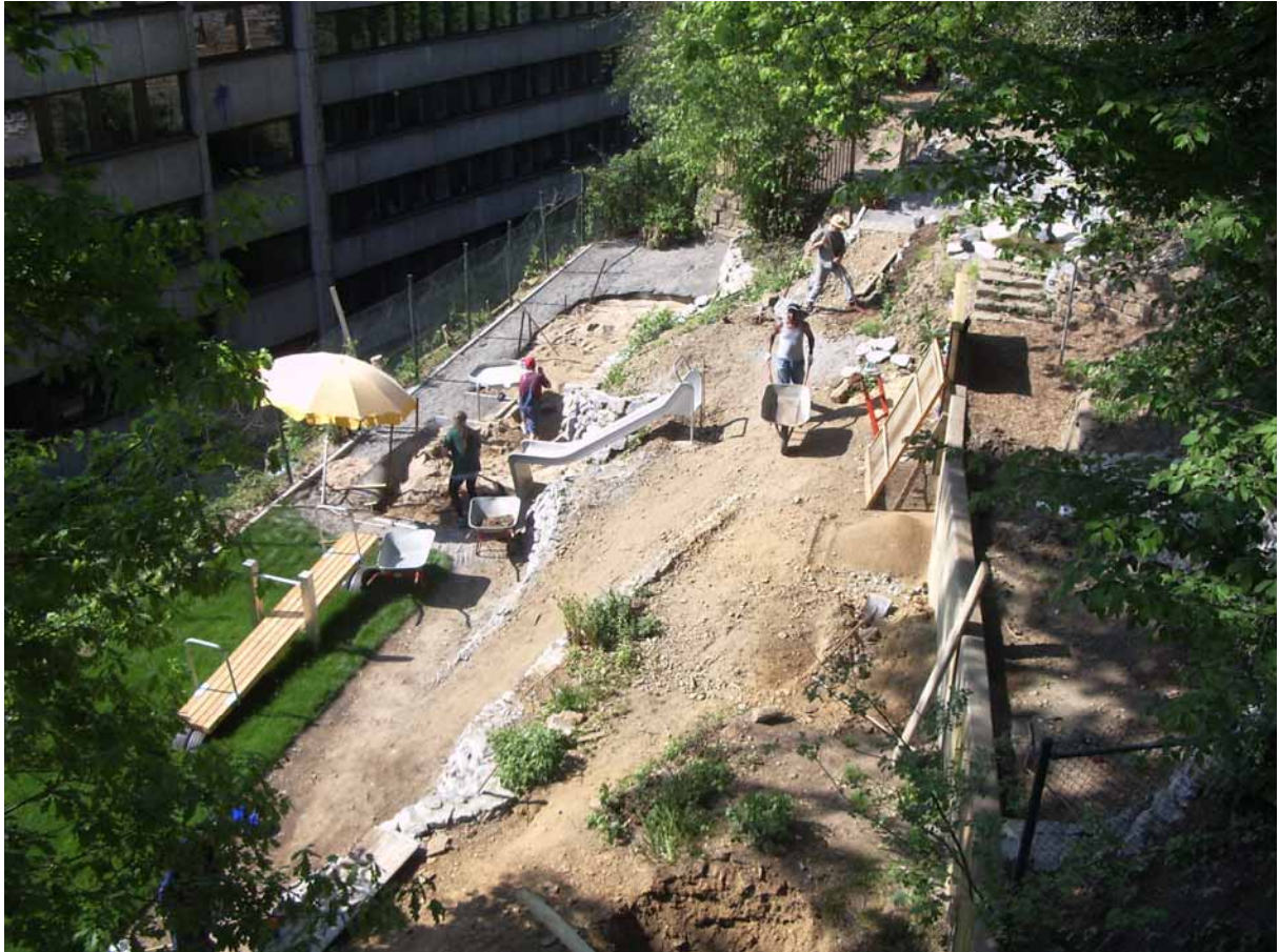
Blick von oben auf die unmodellerte Geländestruktur.