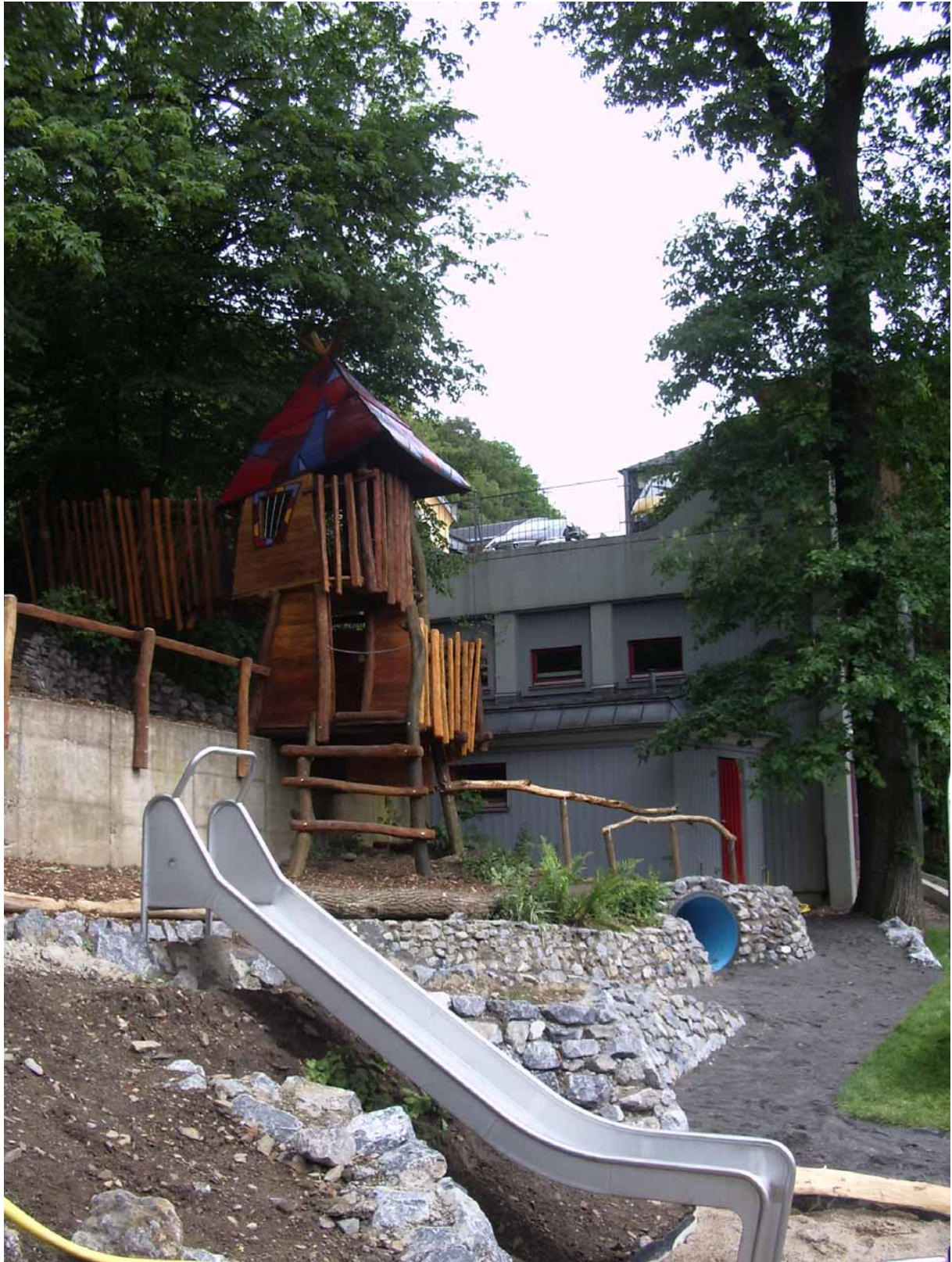
Edelstahlrutsche verbindet mittlere und untere Ebene. Kalksteinmauer, Baumhaus, Kriechtunnel. Im Hintergrund Turnhalle und Schulgebäude.