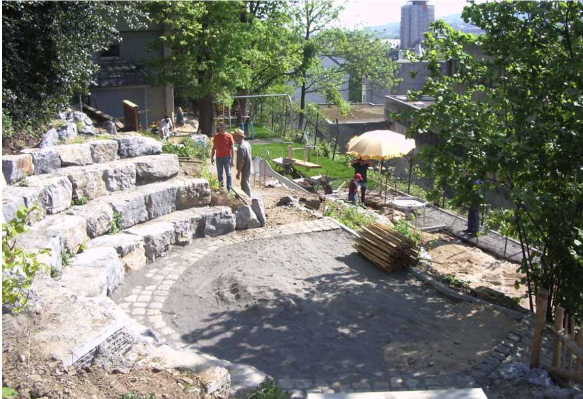
Atrium (grünes Klassenzimmer) aus hiesigen Kalksteinquadern. In der Bildmitte die Rollstuhlschaukel und der unterfahrbare Matschtisch.