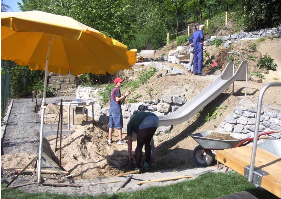
Arbeiten an Rutsche, Sandkasten und Atrium.